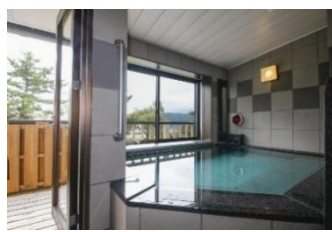
【二階のびわ湖を眺めながら入るお風呂】