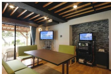
【一階のカラオケ部屋】