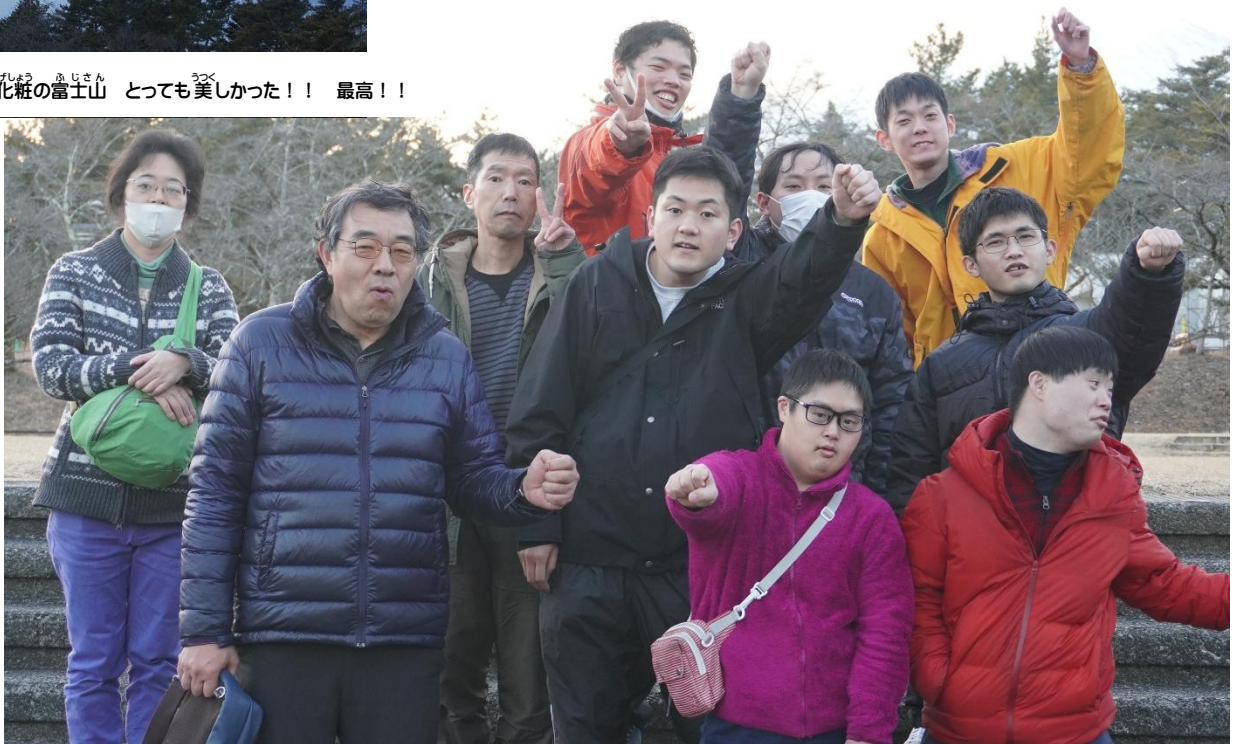
ふゆがっしゆく こくりつちゆうおうせいしやうねんこうりゆう いえ つどのひろばにて R8.2.22冬合宿 国立中央青少年交流の家 つどの広場にて