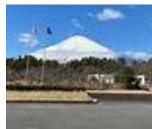
国立中央青少年交流の家から見える富士山

冬合宿は雪化粧の富士山を見に静岡県御殿場市の中央青少年交流の家に行きます。参加利用者は13名と毎年冬合宿は本当に参加者が少ないです。今回の合宿では雪遊びは出来ませんが壮大な富士山を眺めながら自然の空気をいっぱい吸ってみんなで大いに楽しみましょう。今回参加しない利用者も次回は参加してくださいね。