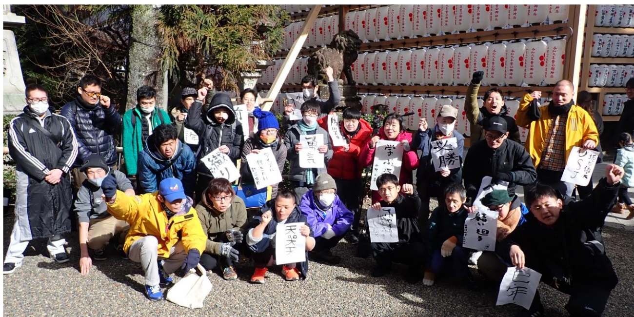
きたのてんまんぐう 北野天満宮にて R7.1.4

社会福祉法人 京都西陣福祉会 障害者多機能型事業所 西陣工房 〒603-8333 京都市北区大將軍東鷹司町 109-1 ☎(075)462-9101 Fax(075)468-9122 mail info@nishijinkoubou.com