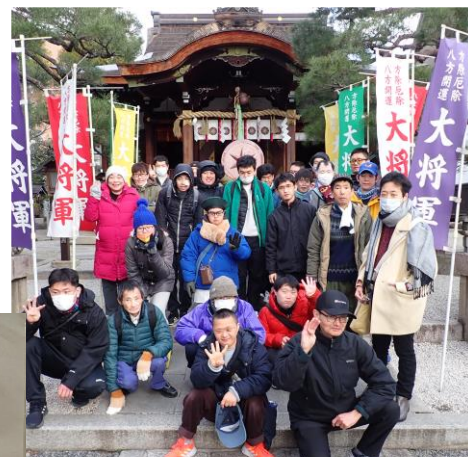
大將軍八神社にて R7.1.4

午後の定番の百人一首大会はグループホームのメンバーの圧勝。そして年末見た「ちはやぶる」の映画の後編を食堂で鑑賞しました。令和7年が始まりました。