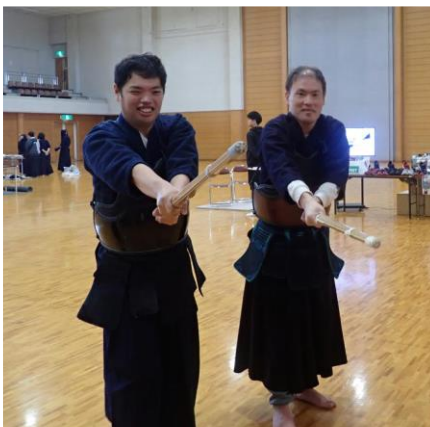
剣道着を付けて め〜ん (武道センター) R6.11.9

アルティを出て蛤御門から御所に入りました。元治元年(1864年)、ここは御所に攻め入る長州藩と御所を守る薩摩、会津、桑名藩との戦い(蛤御門の変)の戦端となったところで、その結果京都市街の3万戸が丸焼けになった(どどん焼け)という説明をここへ来る度にして来ましたが、誰も覚えていませんでした。御所を東に横断すると左に京都御所の正門である建礼門で記念撮影をしてから寺町通りを渡って河原町通りを下がり、次はアートスペースコージンに立ち寄りしました。狭いアトリエに「表現のてざわり」というテーマで障害者アートがたくさん展示されていました。少し休憩させていただき、今度は丸太町を東へ進み、11時10分に武道センターに到着して早速卓球バレーコーナーで賑やかに行いました。残念ながら我々以外の参加は少なく、盛況というにはほど遠い中、隣のスペースで長刀や剣道の体験をしてから昼食を食べて次は久々の動物園に行きました。日本で2番目に古いこの動物園は9年前にリニューアルをしている角度から動物が見られるようになったのが評判で結構賑わっていました。確かにキリンや象はなかなかの迫力がありました。ただ、最近虎が死んで猛獣のコーナーはジャガーと山猫しかいないのが淋しかったですね。動物園で結構長居したので、蹴上げから西大路まで地下鉄に乗り、16時過ぎに西陣工房に帰りました。朝は寒かったけれど、日中は暖かまだ紅葉には早い秋の1日でした。今回はわずか2万5千歩でした。(河合)