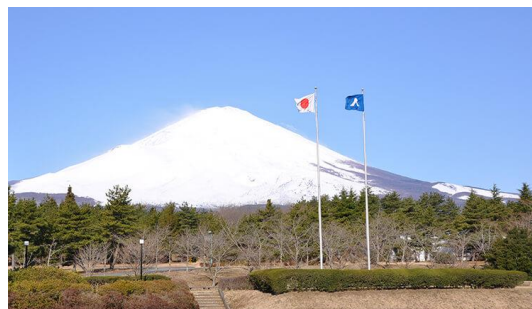
交流の家から見える冬の富士山

今回の合宿は、JRを利用して静岡県御殿場市にある国立中央青少年交流の家へ行きます。参加人数によって観光等の変更はありますが、交流の家では広大なグラウンドを借りて色々なスポーツを行います。西陣工房帰着は24日(月)18時ごろを予定しています。参加費は2泊3日7食付き交通費、観光費等すべて込みで2万3千円です。参加される方は1月分の利用者負担金と一緒に引き落としさせていただきます。富士の直下に広がる森の中、豊かな大自然と壮大な冬化粧の富士山を眺め色々な体験をしましょう。皆さん奮って参加してください。 ※参加人数が少ない場合は合宿を中止する場合があります。