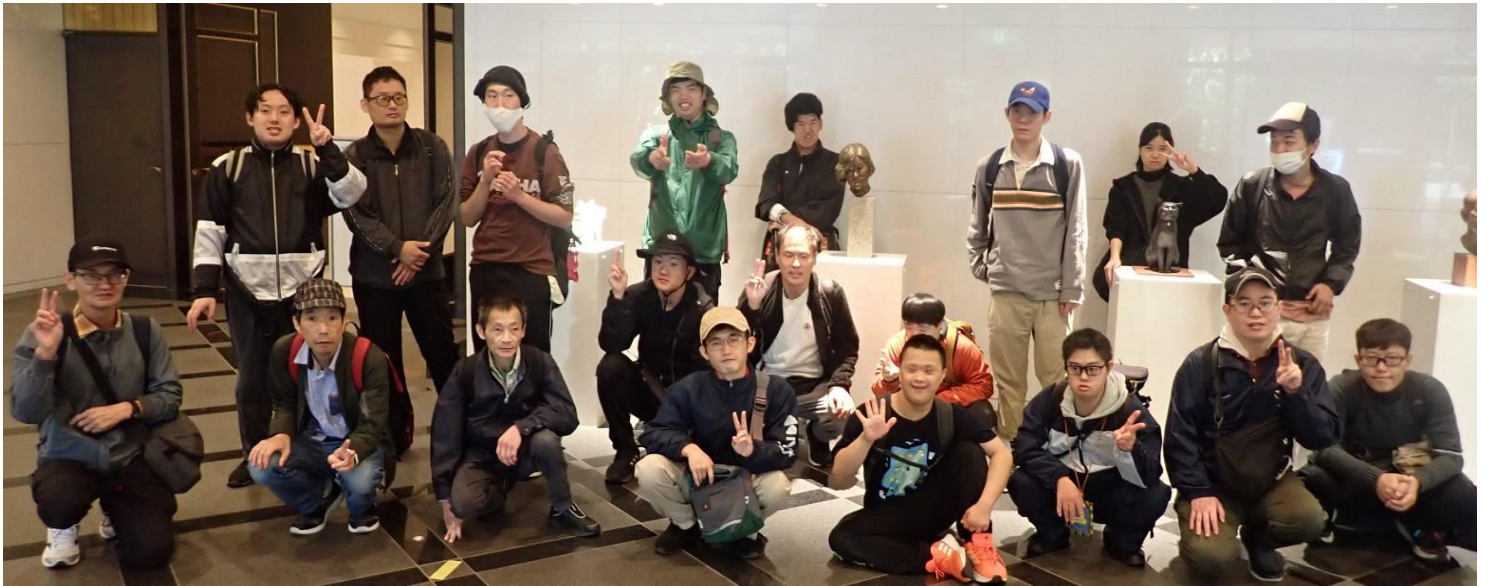
府民ホールアルティロビーにて R6.11.9

社会福祉法人 京都西陣福祉会 障害者多機能型事業所 西陣工房 〒603-8333 京都市北区大將軍東鷹司町 109-1 ☎(075)462-9101 Fax(075)468-9122 mail info@nishijinkoubou.com