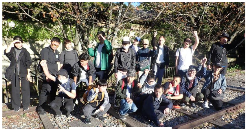
インクラインにて R6.11.9