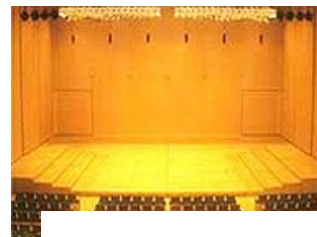
府民ホールアルティ

11月のウクレレサークルは船岡スタンダードのステージ発表に向けて前日に練習します。ステージでは4曲披露します。(里の秋、もみじ、琵琶湖周航の歌、翼をください)各自でしっかり練習しておいてくださいね。また、来年4月に府民ホールアルティでのコンサートもありますので、各自の練習が大変重要になってきます。今後、特別レッスンも何回か企画する予定ですので必ず参加してください。