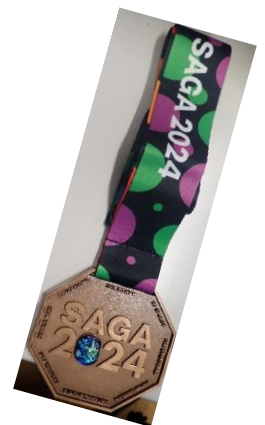
佐賀全スポーツ大会 3位メダル

様々な経験を経て、今回の大会に挑みました。午前中のブロック戦(15点2セット)では、火の国(熊本県)とかがらす卓球バレークラブ A(佐賀県)と対戦しました。それぞれ速く強い打球を打ってくるチームでしたが確実ブロックし予選1位で通過し、午後からの決勝トーナメント(11点3セット)に進出しました。午後からはまずハナミズキ(佐賀県)と戦い勝利しました。準決勝ではアスレクト(岩手県)と戦い3セット目の10-10まで続き、最後の1球では疑惑の判定(誤審)と言わざるを得ない残念な失点となりました。主審に説明を求めましたが納得のいく説明がありませんでした。その後の3位決定戦ではフレンドリー春日部(埼玉県)と戦い、勝利しました。今年も3位という結果に終わりました。