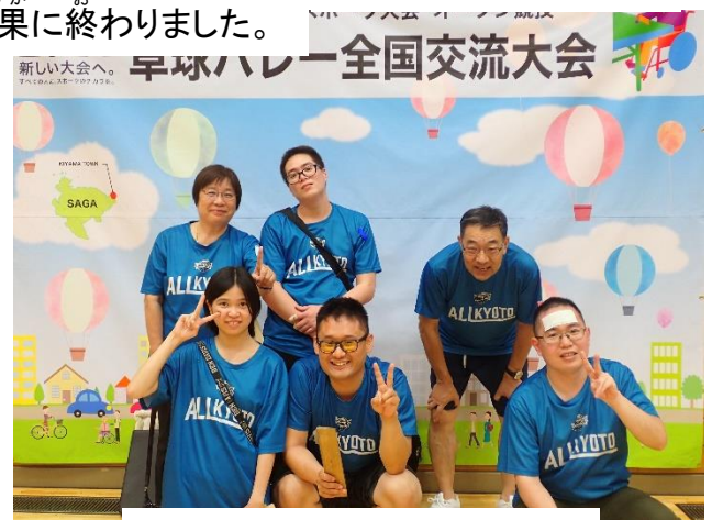
佐賀県基山町体育館 R6.10.20

「勝負は時の運」とはいいますが、あと1点引き寄せられなかったのが残念で仕方ありません。卓球バレーの発展のためには公平な試合をすることが不可欠です。公平な試合には公平なジャッジが必要です。選手、審判員ともルールを正しく理解し、正しく適用し続けることが一番の道ではないかと思えます。(富田要亮)