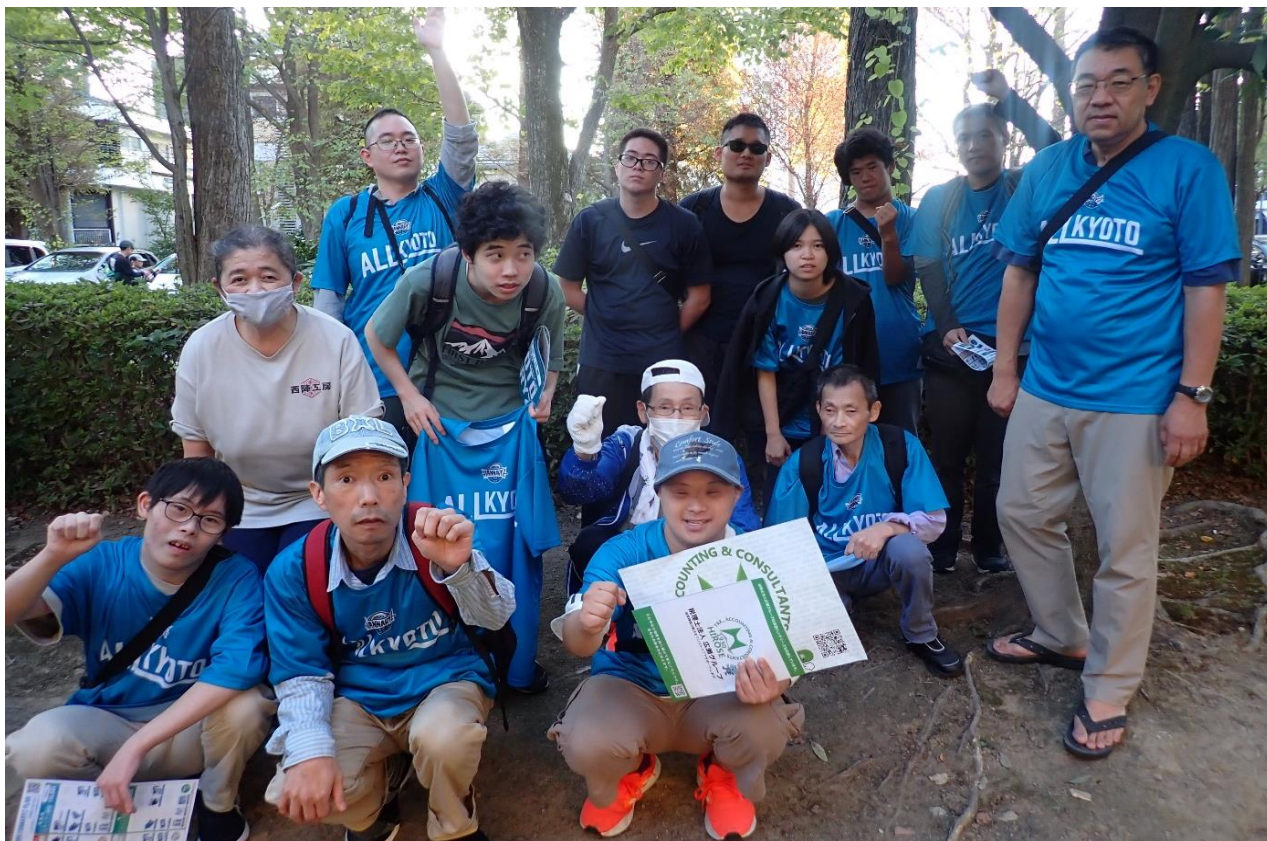
迫力満点の試合でした!! 京都ハンナリーズ R6.10.13 かたおかアリーナ前広場にて

社会福祉法人 京都西陣福祉会 障害者多機能型事業所 西陣工房 〒603-8333 京都市北区大將軍東鷹司町 109-1 ☎(075)462-9101 Fax(075)468-9122 mail info@nishijinkoubou.com