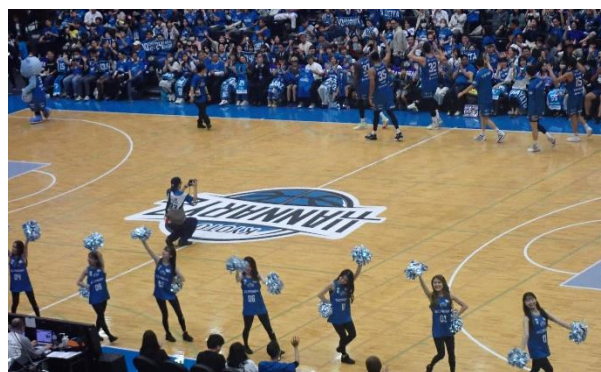
京都ハンナリーズのチアガールズ R6.10.13

プロバスケットボールの京都ハンナリーズの招待券を頂き観戦しました。この日の対戦相手は群馬クレインサンダーズです。受付で京都ハンナリーズのTシャツを頂きそのTシャツを着てみんなで応援しました。会場が見事にブルー一色でした。迫力あるプロのバスケットボールを生で観戦し、ハーフタイムにはチアリーダーの素晴らしい踊りや色々な企画もあり3時間近くを飽きさせない演出で素晴らしかった。この日は京都ハンナリーズが勝ちました。