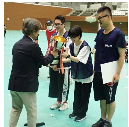
一般の部表彰式 2連覇達成!!(島津アリーナ)R6.6.23