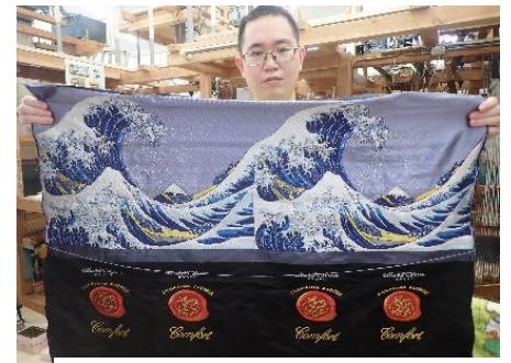
葛飾北斎 「富嶽三十六景・神奈川沖浪裏」 【錦広幅90cm機】