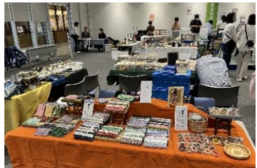
ほっとはあとマルシェで製品販売(KOTOホール)R6.6.8

第4回ほっとはあとマルシェが6月8日(土)イオンモール京都で開催されました。今回も京都ほっとはあとセンターに加盟している市内ブロックの事業所が25施設集まり、製品販売やワークショップ、ステージ発表などを通して交流し、また事業所の事を多くの方に知ってもらうことを目指しました。西陣工房からはエコバックやキーチェーンの販売、組紐体験やしおり作り、ウクレレ演奏によるステージ発表など、盛りだくさんの内容で参加しました。特にウクレレの演奏では白頃からしっかりと練習してきた4曲を演奏して会場を盛り上げました。演奏に反応してお客さんからアンコールの声も出て、なごやかな雰囲気での演奏でした。(長橋)