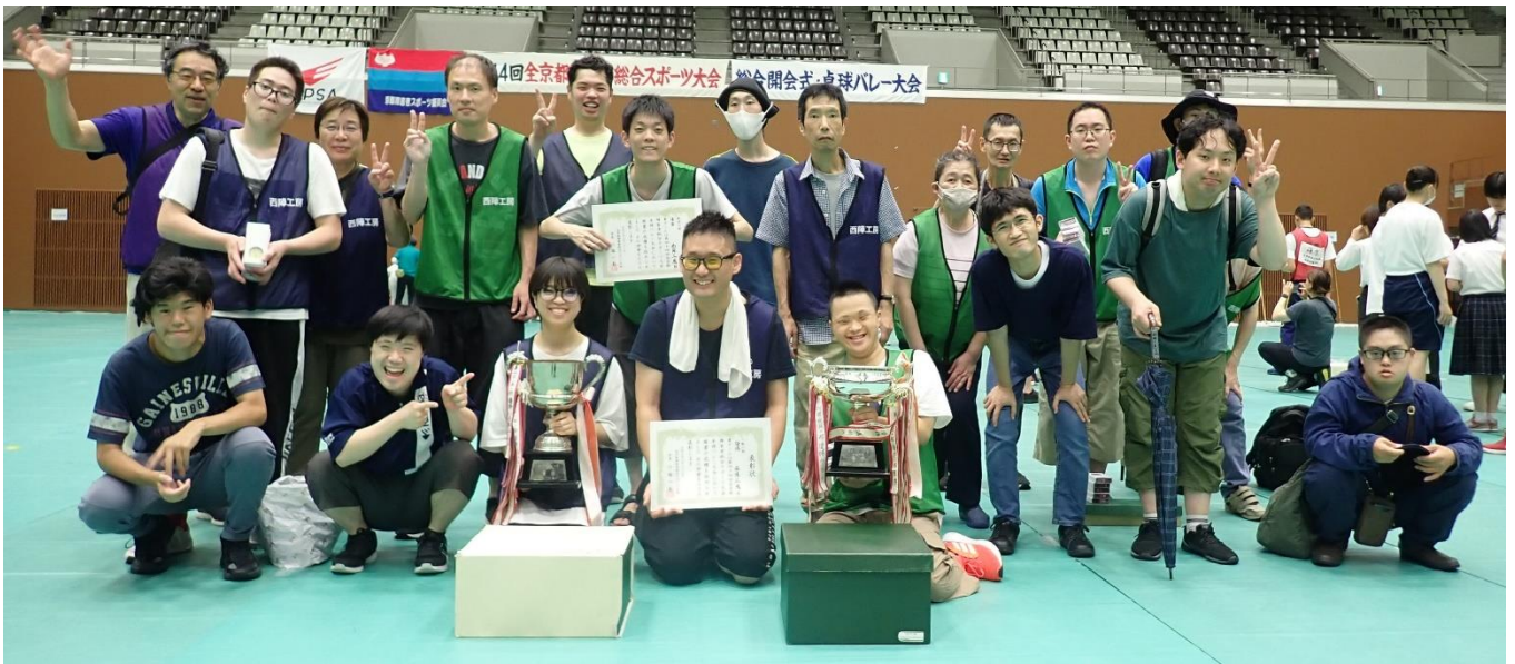
全京都障害者スポーツ大会卓球バレーの部 一般の部・施設の部 W 優勝！！R6.6.23（島津アリーナ）

社会福祉法人 京都西陣福祉会 障害者多機能型事業所 西陣工房 〒603-8333 京都市北区大將軍東鷹司町 109-1 ☎(075)462-9101 Fax(075)468-9122 mail info@nishijinkoubou.com