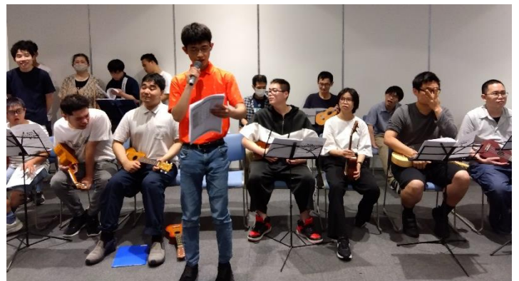
ステージ発表(KOTOホール)R6.6.8