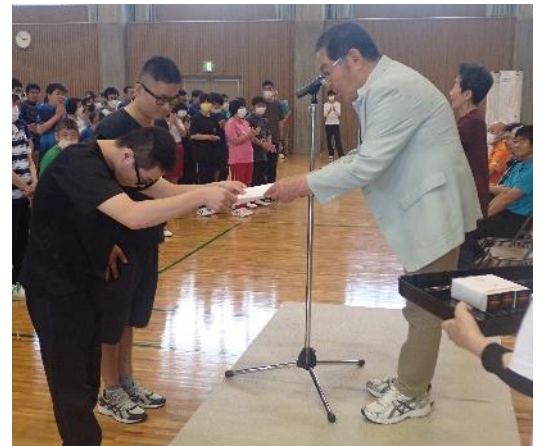
初優勝!!表彰式(萩ウエルネスパーク)R6.6.15

10月の佐賀国体で全国制覇をするためには必ず勝たなければならない全国チャンピオンである「ひまわり」チーム(山口県萩市)と対戦するため山口県萩卓球バレー交流大会に参加しました。参加したのは佐賀県、大分県の強豪チームを含めた6チーム。試合は6チームの総当たり戦で5試合すべてに勝利しての優勝を目指すことになりました。各チームは地域を代表する実力あるチーム。1試合自から集中力全開で戦い、苦しい戦いを1戦ずつ勝ち進み、4戦全勝で迎えた最後の大一番が「ひまわり」チームとの全勝対決となりました。ここ10年、惜しいところまで行くが全く勝てなかったひまわりチーム。惜敗した平成30年の福井国体の決勝などが思い起こされます。いつもだったら緊張感で顔がこわばったり、手が震えたりするのですが、練習の成果あってか、今回はみんなでそれを乗り越え、何とあのひまわりにストレート勝ちしてみごと優勝を勝ち取りました。うれし涙は国体までお預けにしたかったけど、自然と涙が溢れてきました。萩は遠かったけれど、勝ったことで疲れも吹っ飛びました。10月の国体本番では再びうれし涙で顔をクシャクシャにしたいですね。