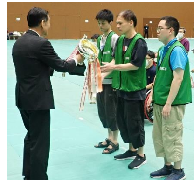
施設の部表彰式 13連覇達成!!(島津アリーナ)R6.6.23

全京都障害者スポーツ大会卓球バレーの部が島津アリーナで開催されました。今回は31チームと昨年より少し増えましたがコロナのような活気はまだまだといった感じでした。西陣工房は、昨年と同じくAチームを一般の部に入れて、施設の部と合わせて2部門でのW優勝を目指しました。午前の予選リーグではA、B両チームは無難に2勝して決勝トーナメントに進出しましたが、Cチームは2戦とも惜敗して予選敗退となりました。午後の決勝トーナメントでは、Aチームは準決勝を城陽プラムを無難に下し、決勝は昨年同様京田辺との対戦となりました。接戦になりましたが、2-0で勝利し、一般の部2連覇となりました。Bチームも危なげなく準決勝、決勝を勝ち抜いて施設の部13連覇を飾り、今年も一般の部と施設の部のW優勝となりました。