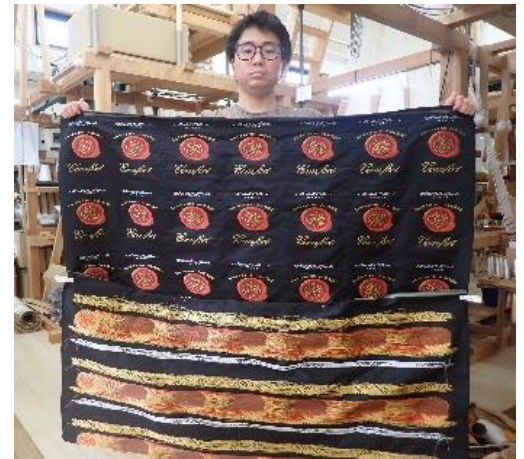
ホテルオークラ京都専門店ロゴ 【電子ジャガード120cm幅機】

織り作業ではホテルオークラ京都専門店様から30周年記念エコバックの注文を頂き、5月に500個を納めた後、追加で520個の注文を頂きました。その為に2台の織り機で生地を織っています。1台は錦広幅90cmで4個を織ることが出来ます。もう一台は電子ジャガードで120cm幅があり、7個の柄を一度に織ることが出来ます。当初は一柄ずつ縫い分けて織っていたのですが、作業時間と納期の事を考えると、力織機のように柄系を飛ばして織ることになりました。縫い取りであれば一柄一色で四十九丁の小杼が要ります。七色使えば七柄の×七色で四十九丁の小杼が要ります。一丁で飛ばして七個の柄を織るので、七色×一丁で七丁の小杼があれば全部の柄が織れることになりました。織幅があるので縫い取り用の小杼では一度に起こすことは難しく、何度も手で起こさなければなりません。数は少ないですが車付きの長刀杼があるのでこれを使って織ると端から端まで一度に越せることが出来て早くなります。こういう備品も用途に応じてそろえて、織る人が楽に綺麗に早く織れるように考えていく必要があります。織り上がった生地は糸が浮いているので加工する時は、張り芯を張り引っ掛からないようにしています。