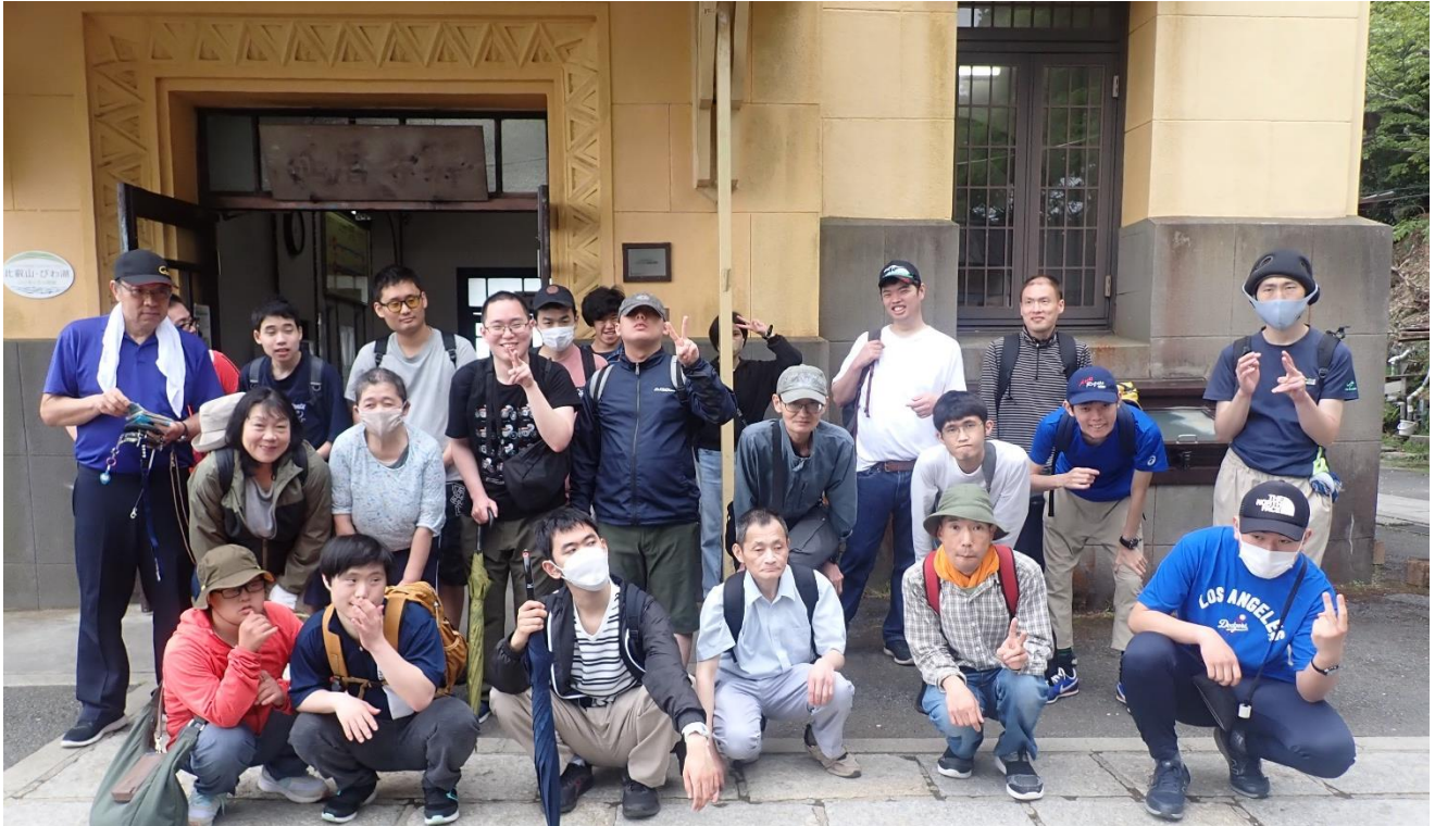
比叡山に行ったよ〜!! ケーブル延暦寺駅にて R6.4.29 (月 昭和の日)

社会福祉法人 京都西陣福祉会 障害者多機能型事業所 西陣工房 〒603-8333 京都市北区大將軍東鷹司町 109-1 ☎(075)462-9101 Fax(075)468-9122 mail info@nishijinkoubou.com