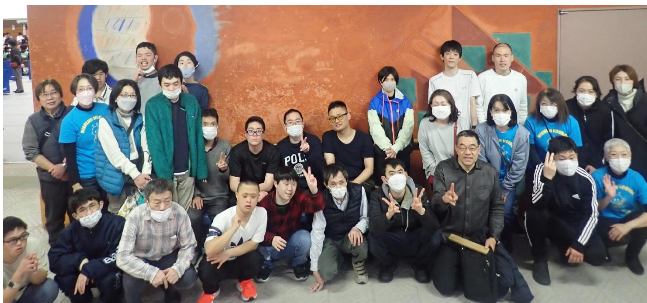
第17回京都卓球バレー協会交流大会 京都市障害者スポーツセンターにて R6.3.24 (日)