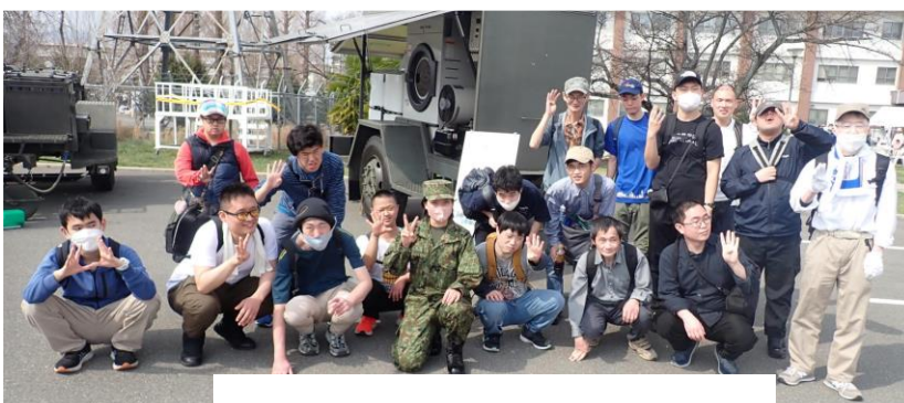
被災地で大活躍の野外洗濯機の前で R6.3.31 桂駐屯地にて

今回の参加者は少し少ない17人でしたが、起伏の少ない歩き慣れたコースなので、1人の脱落者も無く、25km程度を歩きました。桜は少なかったけれど、桂川の土手に咲く菜の花と天神川の桜の下に咲く雪柳は見事でした。よく見ると、たんぽぽ、レンゲ、桃などもしっかりと咲いており、春霞と柔らかい春風と共に、花粉や黄砂もありますが、春の到来を感じた1日でした。(河合)